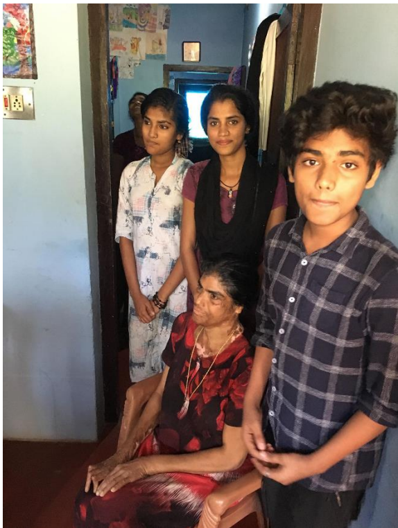
Hele familien samlet i sitt hjem.